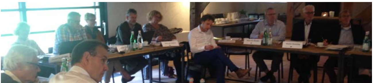
Foto : Kick-off Meeting met het Project team, de Klankbordgroep, onze Nederlandse en Belgische Actuarissen en Externe Juristen.